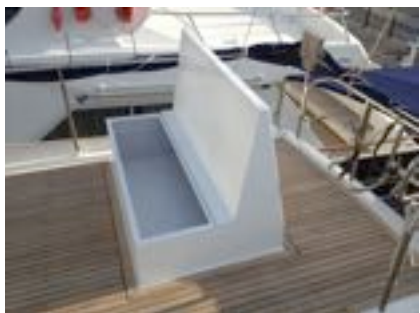
Modification du pont pour placer la banquette arrière