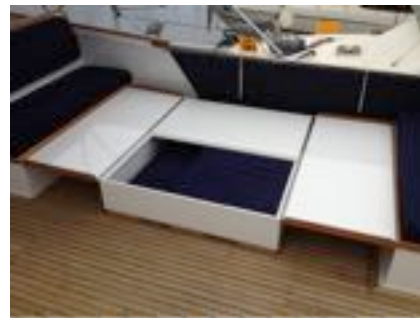
La table avec son coffre de rangement et ses panneaux ouverts