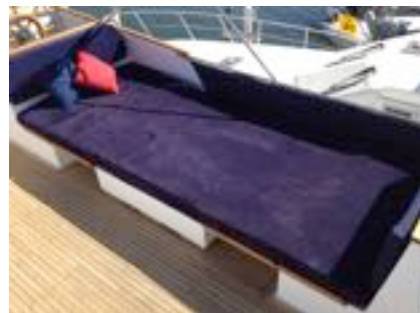
Une fois dépliée, la table se transforme en un vaste bain de soleil