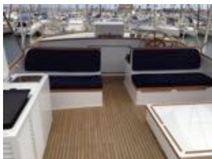
A noter le pont bombé qui nécessite une grande maîtrise dans l'ajustage