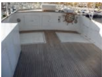
Démontage des meubles