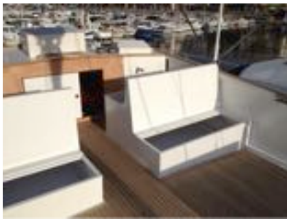
Nouvelles banquettes asymétriques et remplacement du panneau avant